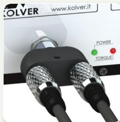
DISPOSITIVO A DOPPIA USCITA PER KBL..FR

Per l'utilizzo contemporaneo di due avvitatori KBL nella stessa area di lavoro, è previsto un dispositivo a doppia uscita. Il modello DOCK02 (codice 020035) è inteso per i modelli KBL..FR, mentre il modello DOCK02/S (codice 020035/S) per KBL..FR/S (con segnali) e KBL..FR/CA (per automazione).