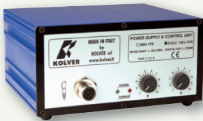
EDU1BL/SG controllo con segnali

Gli avvitatori KBL Kolver sono abbinati ad una unità di controllo che assolve le funzioni di trasformatore di corrente AC/DC e di regolatore elettronico delle diverse caratteristiche richieste al motore. Il circuito elettronico di controllo arresta l'alimentazione di corrente dell'avvitatore al raggiungimento della coppia prefissata. Le unità di controllo EDU1BL per la serie KBL montano schede switching di potenza elevata a voltaggio universale. Utilizzano la tecnologia a mosfet che riduce drasticamente l'usura di tutti quei componenti che normalmente devono essere cambiati dopo un certo numero di cicli. Sono fornite standard con velocità di lavoro regolabile (dal 60% al 100%) e un led verde che segnala l'accensione dell'unità. È inoltre disponibile l'unità di controllo tipo SG, che lavora con gli avvitatori KBL..FR/S o KBL..FR/CA e fornisce i segnali di raggiungimento coppia e di leva premuta e riceve quelli di avvio e inversione remoti. Tramite un dispositivo a doppia uscita è inoltre possibile utilizzare contemporaneamente due avvitatori con una sola unità di controllo.