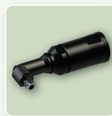
TESTINA AD ANGOLO

*Tutti i modelli sono disponibili con impugnatura a pistola. I KBL dritti sono inoltre disponibili nei modelli KBL..FR/AR, con svitatura automatica al raggiungimento della coppia.