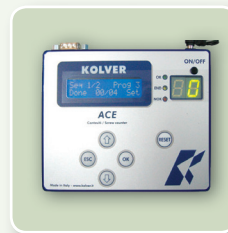
ACE CONTA VITI (v. pagina 24)